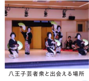
八王子芸者衆と出会う場所

令和元年11月、黒堀に柳が揺れる新たな和のスポットが花街にオープンしました。古くから織物業で栄え、「桑都」と呼ばれていた八王子。その繁栄とともに発展したのが八王子の花柳界でした。 「桑都テラス」では、これまでハレの日のものだった花柳界の伝統文化に身近に触れることができる注目を集めています。 桑都テラス恒例の催しが「日常の八王子芸者」と「落語」。芸者さんが普段行ってお稽古や趣味をお客さんと一緒に体験したり、わざわざ都心までいなくても一流の落語や演芸を楽しめるので、インスタグラムやサイトでもフォロワーが増えてきました。 また、初めての芸者体験にぴったりの「芸者テラス」もはじまりました。ランチや会食を交えて、花柳界のお話やお座敷遊びの体験ができるのも、お座敷は敷居が高いという女子も、これなら気軽に参加できます。 手土産にぴったりの和洋のスイーツやランチも夜も楽しめるお酒にこだわったお店など、桑都テラスにあるお店は中面で詳しくご紹介。赤い番傘が映える和空間で、特別な時間を過ごせる場所です。