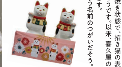
陶器の置物 7,600円 オリジナル手ぬぐい 1,320円

その蔵のなかから出てきたのが、この招き猫。焼け残ったとはいえ、焼き状態で招き猫の表面についていた焼け跡やススはその時のものだそうです。以来、喜久屋の家業と花街の移り変わりを見守り続けています。 実はこの招き猫「重吉」と「美吉」という名前のつがいで、喜久屋ではこの二匹をモチーフにした陶器の置物やぬいぐるみなど、幸運を呼ぶオリジナルグッズも販売しています。 戦火をくり抜いた、強運の招き猫として地元で親しまれ、お賽銭を供える人も。花街散策の際は「パワースポット」として、ぜひ喜久屋に立ち寄ってみてください。