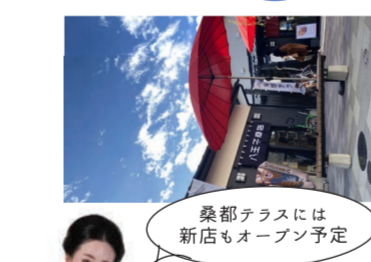
桑都テラスには 新店もオープン予定

花街のまちづくり 中町地区まちづくり協議会は、地元の人々が伝統と文化を活かしたまちづくりに取り組みしています。 猫をモチーフにした花街の歴史文化を紹介する「絆な中町お散歩小路」を発行したり、最近では三業組合のシャッターに、芸者猫のイラストも。花街を楽しむプロジェクトに今後、もぞうご期待！