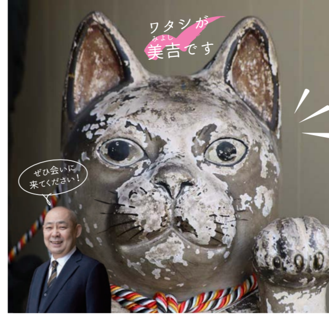
ぜひ会いに来て下さい！