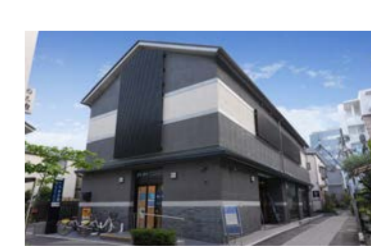
中町12-11-1 営業時間 1F 10:00～19:00 2F 10:00～20:00(21:00) ※2Fは使用申込が無い場合閉館 毎月第4水曜日 定休 https://machi-naka.net

またなか休憩所 八王子宿 まちなか散策やイベントの時に、気軽に憩えるスポット。 きれいなトイレと休憩スペースのほか、赤ちゃん・ふらつとやバウダールームが無料で利用できます。