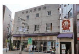
中町9-11 [MAP-A] 営業時間 10:00～ 無休(元日以外) http://www.a-kikuya.com

昭和20年8月2日の八王子空襲で市内は大きな被害を受け、家屋の8割が焼けたと伝えられています。その戦火のなかでも焼け残った、ある瀬戸物店の蔵。その主から「大きな被害のため、商売をやめる。どうか蔵の中の品物を買って取ってほしい」と知人であった仏壇店・喜久屋の初代店主が頼まれたそう。